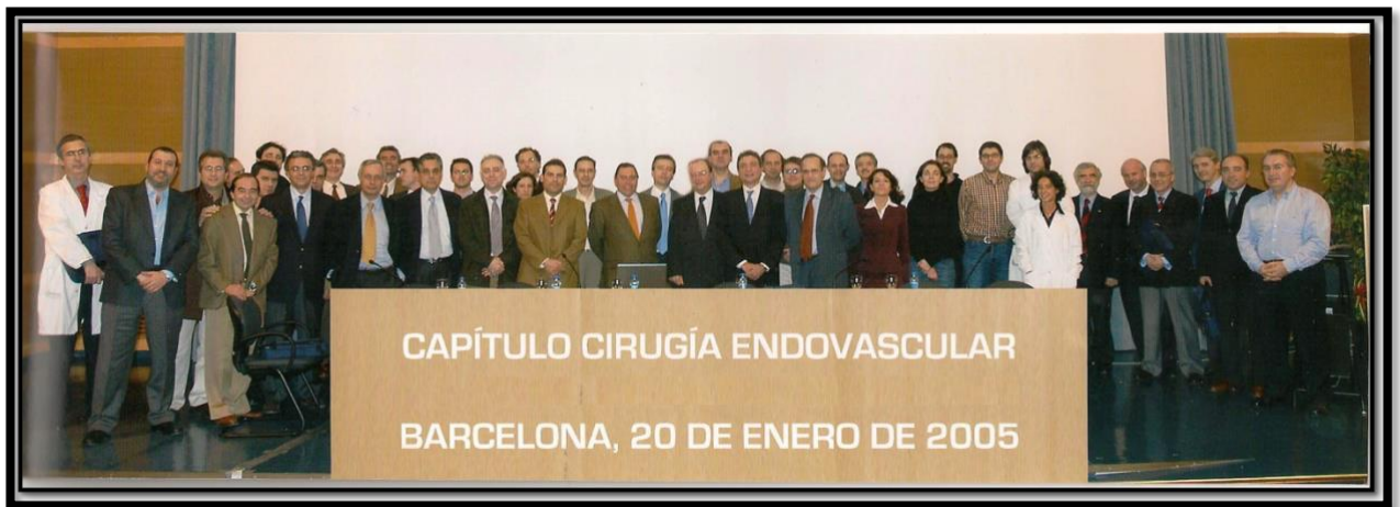
Foto histórica del CCEV, tomada en un evento endovascular en el Hospital Val d'Hebrón, Barcelona, 2005.